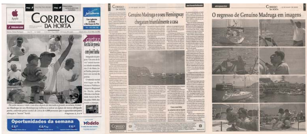
Notícia de capa e duas páginas interiores (2 e 5), publicada no número 20455, do Jornal "Correio da Horta", em 22 de Maio de 2002.