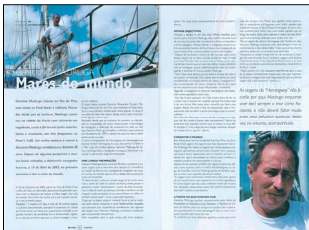
Reportagem de duas páginas (20 e 21), publicada na revista "DI", do número 17405, do Jornal "Diário Insular", em 17 de Agosto de 2003.