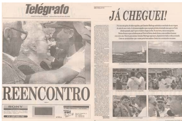
Notícia de capa e uma página interior (2), publicada no número 28914, do jornal "O Telégrafo", em 22 de Maio de 2002.