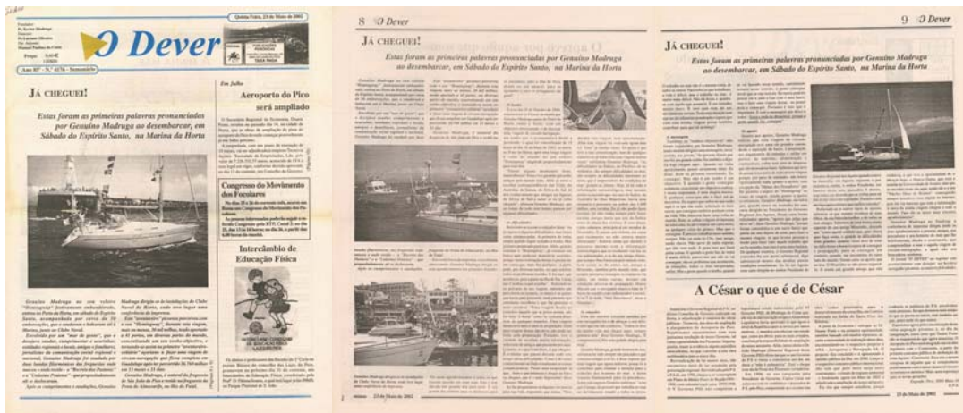
Notícia de capa e duas páginas interiores (8 e 9), publicada no número 4176, do jornal "O Dever", em 23 de Maio de 2002.