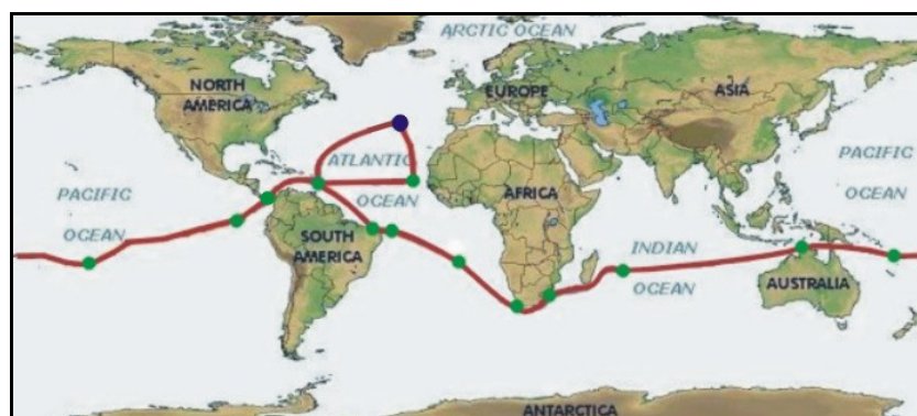
A Rota do Hemingway à volta do Mundo na primeira viagem.

Não esquecendo o seu passado de mestre pescador, em cada novo sítio ausculta os pescadores tentando obter informações sobre as artes tradicionais, as espécies capturadas e outras curiosidades culturais. Simultaneamente, transmite os saberes açorianos e as formas de capturar pescado no nosso arquipélago.