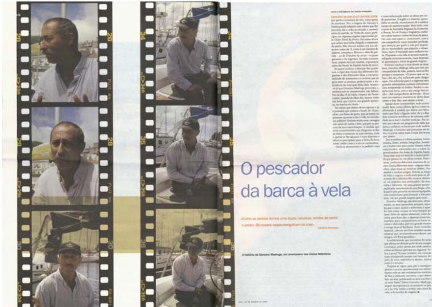
Publicado nas páginas 16 e 17, do nº 299 da revista “DNA” integrante do jornal “Diário de Notícias” de 24 de Agosto de 2002.