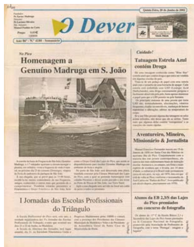
Notícia de primeira página, publicada no número 4180, do jornal "O Dever", em 20 de Junho de 2002.