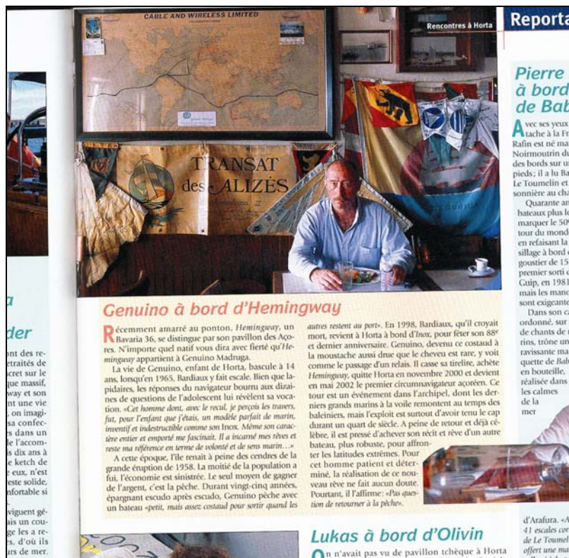
Publicado na página 97 da revista francófona “Voiles et Voiliers” número 393, de Novembro de 2003.