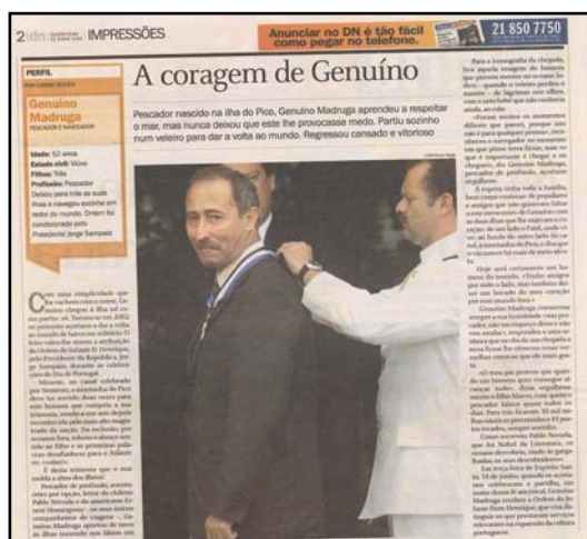
Notícia publicada na página 2, do número 49020, do jornal "Diário de Notícias", em 11 de Junho de 2003.